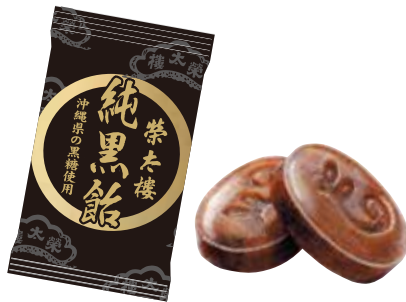
■ 純黒飴 500g入 1,944円 (本体価格1,800円) 1kg入 3,888円 (本体価格3,600円)