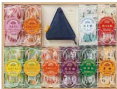
榮太樓 飴・果汁飴 10本入