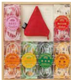
榮太樓 飴・果汁飴 6本入