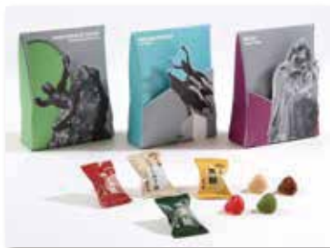
「榮太樓飴 ポップアップボックス」 箱デザイン