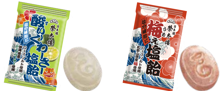
■ 酸い〜くわ〜さ〜塩飴 1kg入(約220粒) 2,700円 (本体価格2,500円)