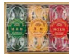
榮太樓 飴 3本入

■ 3本入 1,836円(本体価格1,700円) 梅ぼ志飴・黒飴・抹茶飴 (136×177×57mm・0.34kg)