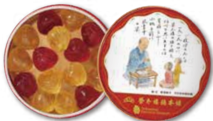
「榮太樓飴 ポケット缶」 シールデザイン

お客様のご要望を伺いながら、榮太樓のお菓子を、ご予算に応じたオリジナルパッケージデザインでお作りいたします。 様々なイベントや記念品、土産品などにご利用いただいております。どうぞお気軽にお問合せください。