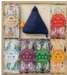
榮太樓 飴 6本入