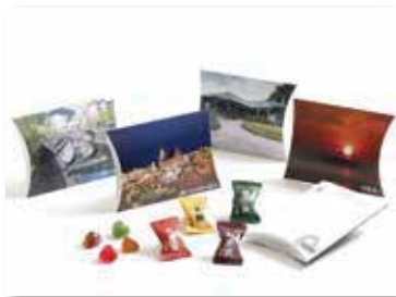
「榮太樓飴 ハガキ型アートボックス」 箱デザイン※切手の貼付で郵送可能